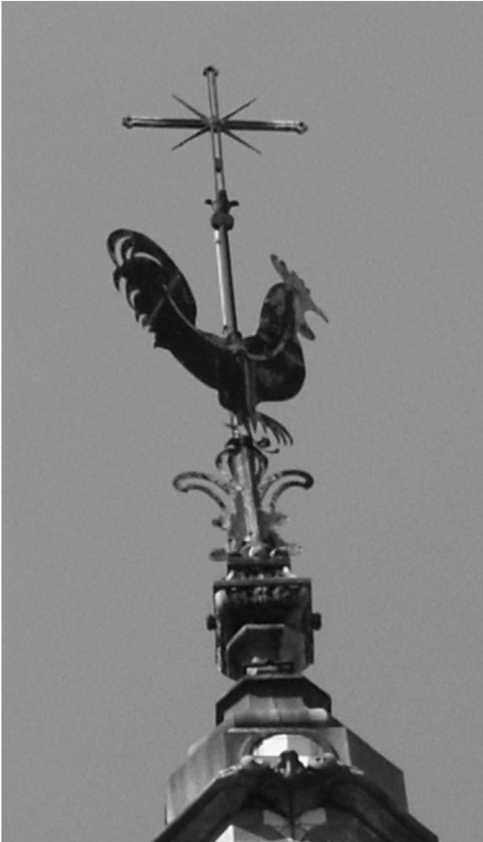
En Rio de Janeiro, Brasil: El gallo sobre una torre de iglesia: él es el primero al que el sol saluda al amanecer: de igual manera un símbolo de la adoración del sol.